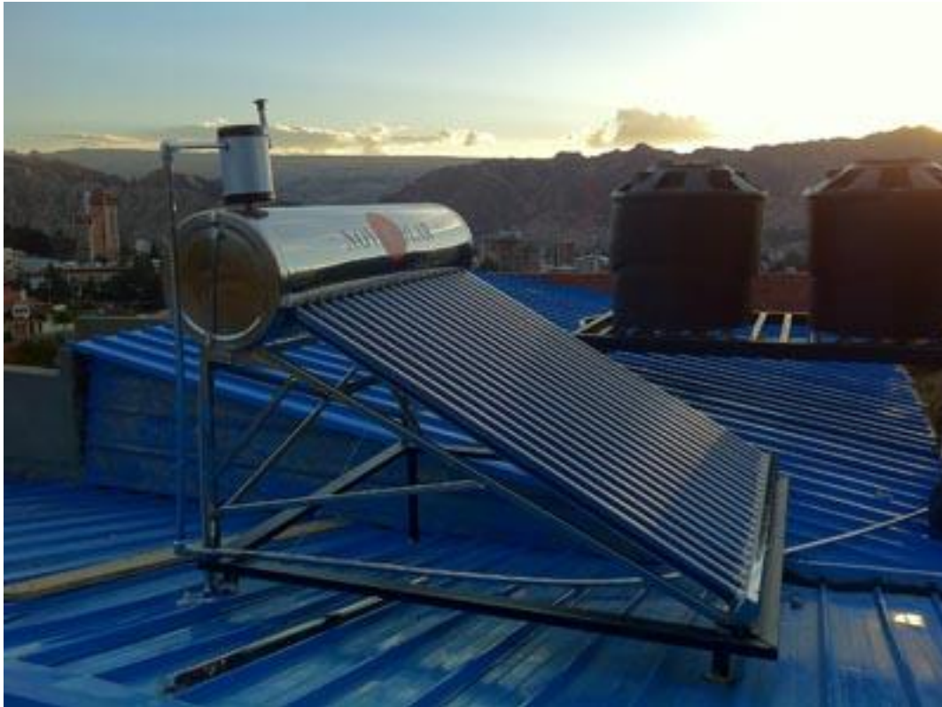
Figura 1. Calefón Solar de Tubos al Vacío “Nova Solar” de 300 Litros. Después del día, el equipo mantiene el calor del agua para poder ducharse en la noche.