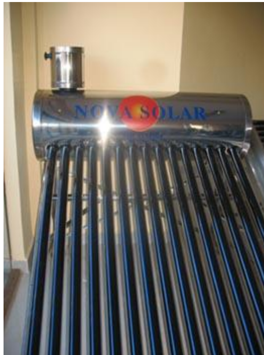
Figura 1. Calefón Solar de Tubos al Vacío “Nova Solar” de 150 Litros