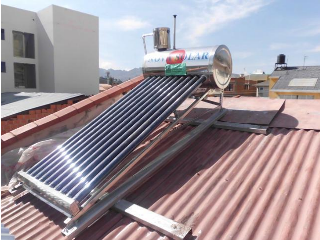
Figura 1. Calefones Solares De Tubos Al Vacio “Nova Solar” de 100 Litros