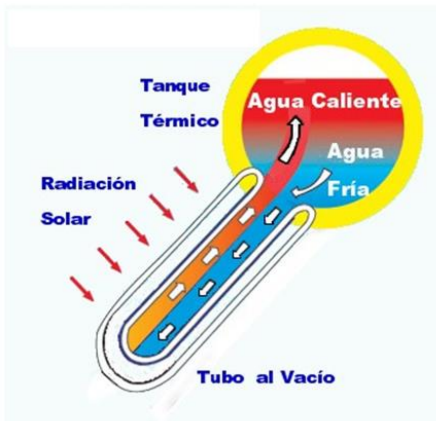
Figura 3: Funcionamiento del calefón solar con tubos al vacío.