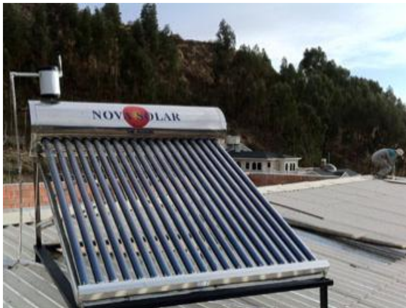
Figura1: Calefón Solar de Tubos al Vacío “Nova Solar” de 200 Litros