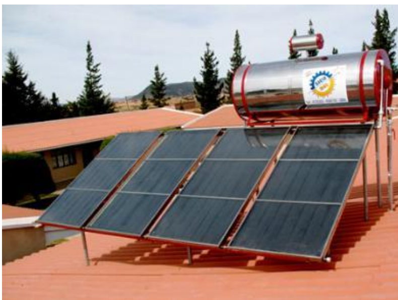
Fotografía 1: EQUIPO SICO SOL MODELO SS-500 para zonas frías.

El calefón solar es un sistema de absorción de rayos solares, transfiriendo este calor al agua durante el día y almacenándola en un termo-tanque asegurando tener agua caliente durante todo el día.