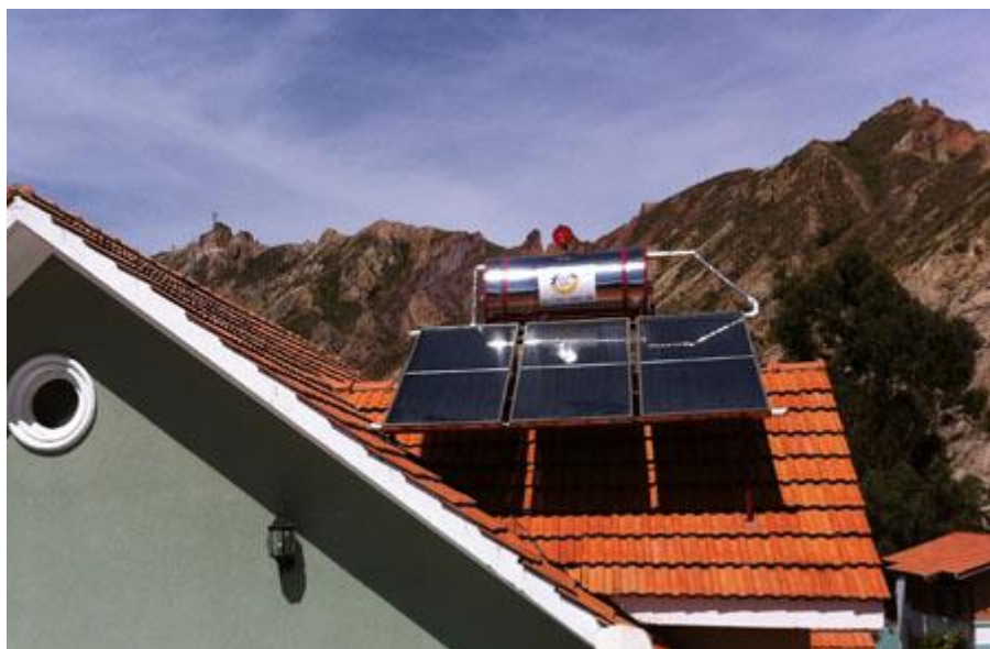
Fotografía 1: EQUIPO SICO SOL MODELO SS-400

El calefón solar es un sistema de absorción de rayos solares, transfiriendo este calor al agua durante el día y almacenándola en un termo-tanque asegurando tener agua caliente durante todo el día.