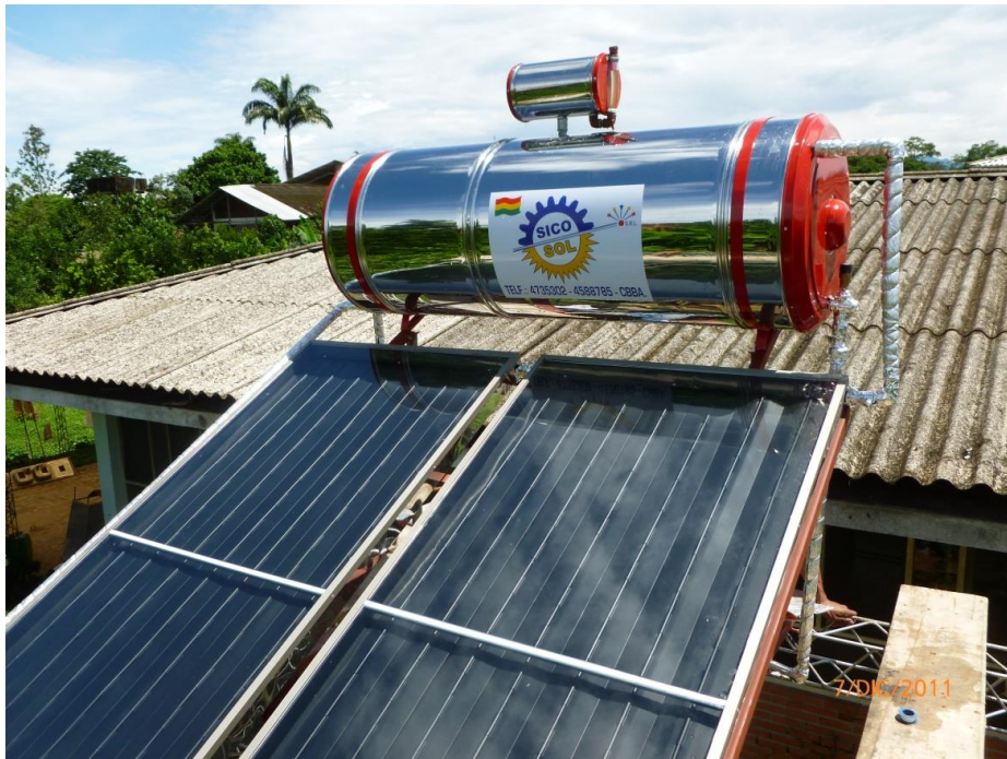
Fotografía 1: EQUIPO SICO SOL MODELO SS-300 para zonas frías.

El calefón solar es un sistema de absorción de rayos solares, transfiriendo este calor al agua durante el día y almacenándola en un termo-tanque asegurando tener agua caliente durante todo el día.