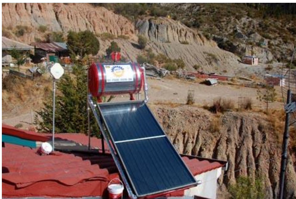
Fotografía 1: EQUIPO SICO SOL MODELO SS-150

El calefón solar es un sistema de absorción de rayos solares, transfiriendo este calor al agua durante el día y almacenándola en un termo-tanque asegurando tener agua caliente durante todo el día.