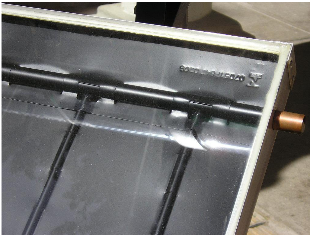
Fotografía 2: Detalle de un colector solar plano. Los tubos para calentar agua están colocados en forma de rejilla.