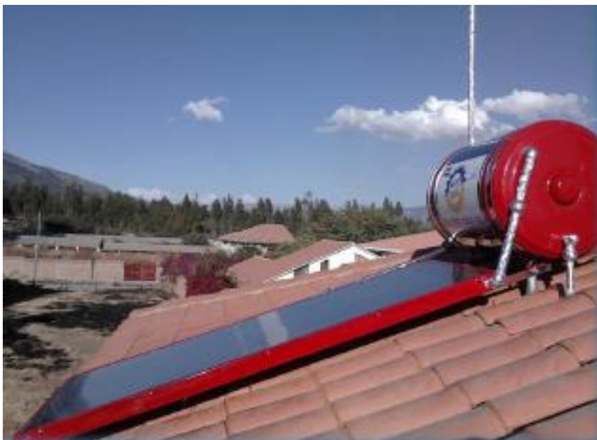
Fotografía 1: EQUIPO SICO SOL MODELO SS-200

El calefón solar es un sistema de absorción de rayos solares, transfiriendo este calor al agua durante el día y almacenándola en un termo-tanque asegurando tener agua caliente durante todo el día.