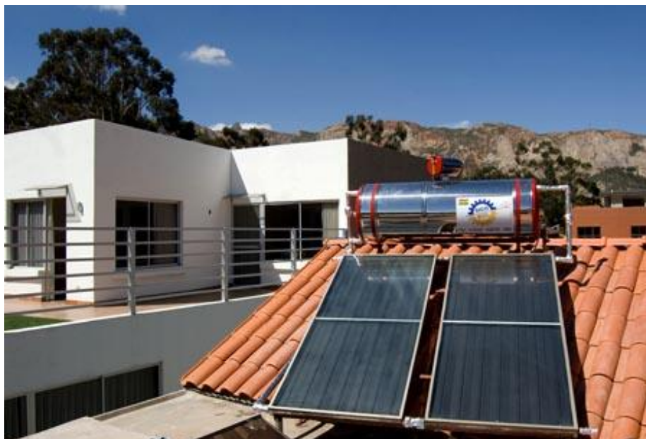
Fotografía 1: EQUIPO SICO SOL MODELO SS-300

El calefón solar es un sistema de absorción de rayos solares, transfiriendo este calor al agua durante el día y almacenándola en un termo-tanque asegurando tener agua caliente durante todo el día.