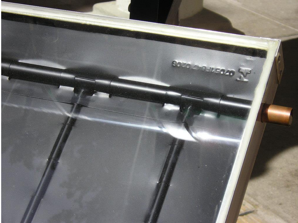
Fotografía 2: Detalle de un colector solar plano. Los tubos para calentar agua están colocados en forma de rejilla.

mediante una placa metálica de color negro mate a la cual se conecta un sistema de tubería de cobre. La placa metálica oscura transmite su calor a los tubos de cobre por donde circula el agua.