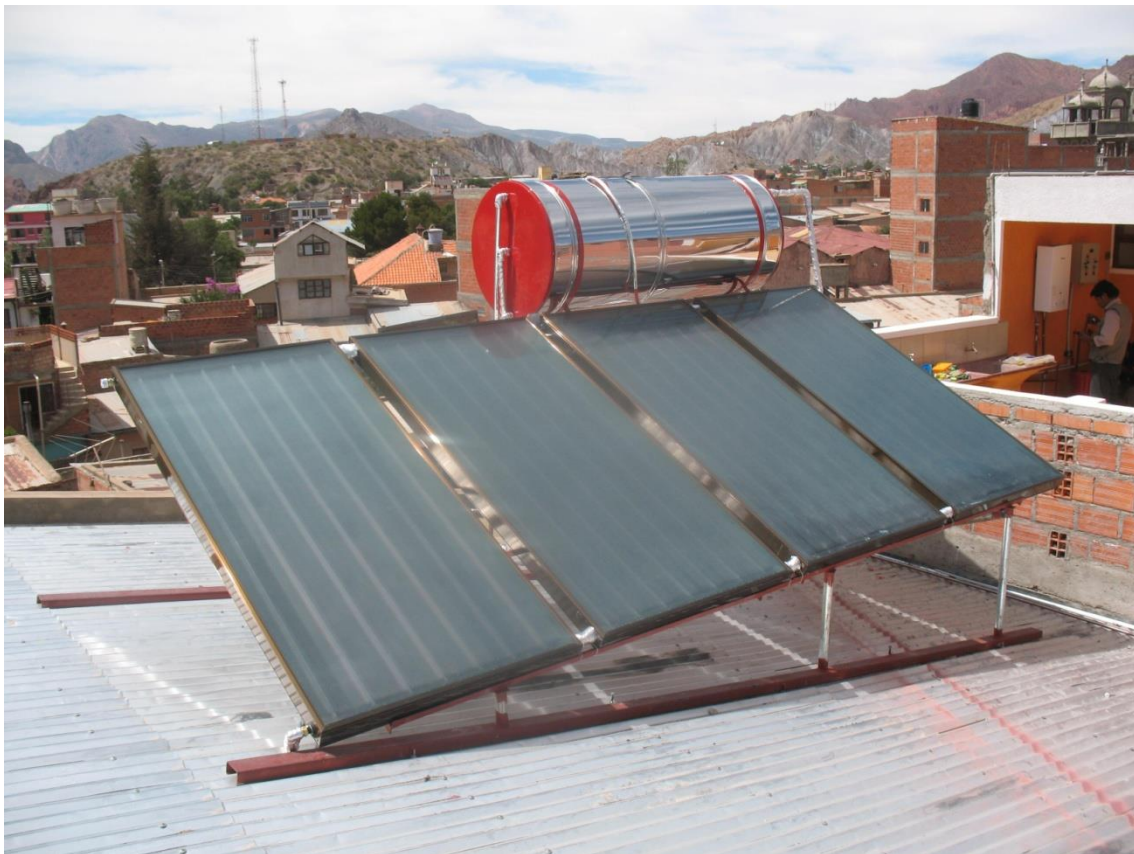
Fotografía 1: EQUIPO SICO SOL MODELO SS-500

El calefón solar es un sistema de absorción de rayos solares, transfiriendo este calor al agua durante el día y almacenándola en un termo-tanque asegurando tener agua caliente durante todo el día.